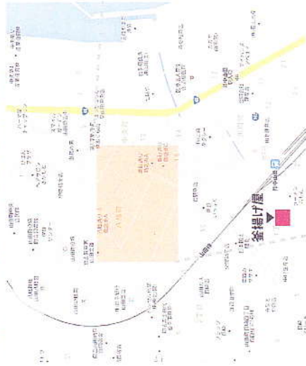
会場広域図 「釜揚げ屋」は当地図をご覧ください。

「山田湾ペーカリー」は、やまだ観光物産館「とっと」(大沢2-19-1)内にて当企画に参加しています。