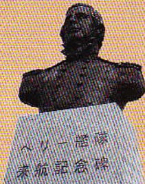
ペリー艦隊 来航記念像