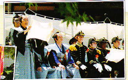
日米下田条約調印の再現劇