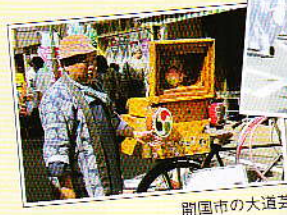
記念公式パレード